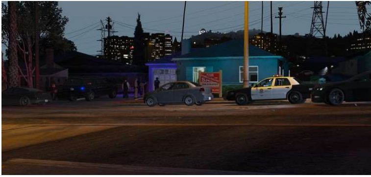
Perquisition d'une maison sur Mirror Park.