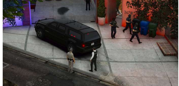
Perquisition d'une maison sur Whispyound Drive, Vinewood Hills.