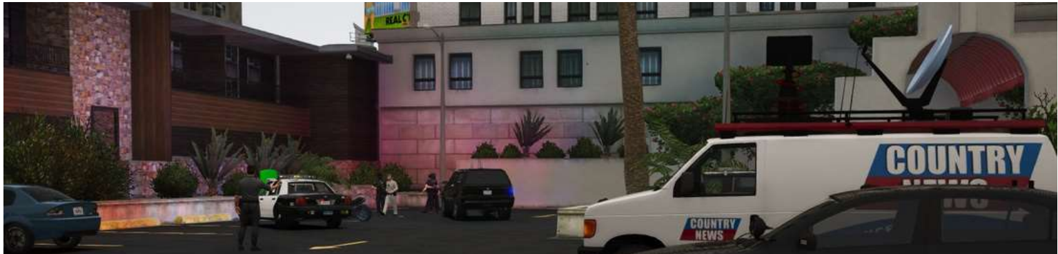
Perquisition à l'hotel de la Fleeca sur Vinewood

En effet, le LSDPS assisté de la SAHP et en présence du procureur ont procédé à sept perquisitions dont quatre sur Los Santos et trois sur Blaine County . Nous n'avons pas plus d'informations sur l'issue de ces perquisitions pour le moment.