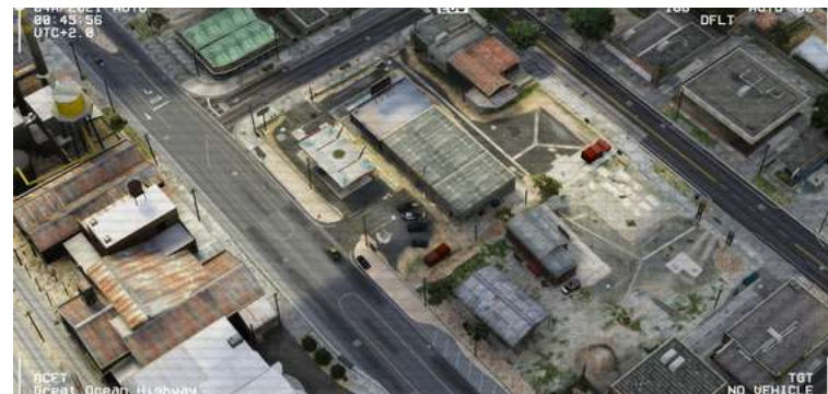
Perquisition du garage WalkersMotors sur Paletto.