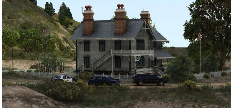
Perquisition d'une maison sur Blaine County.