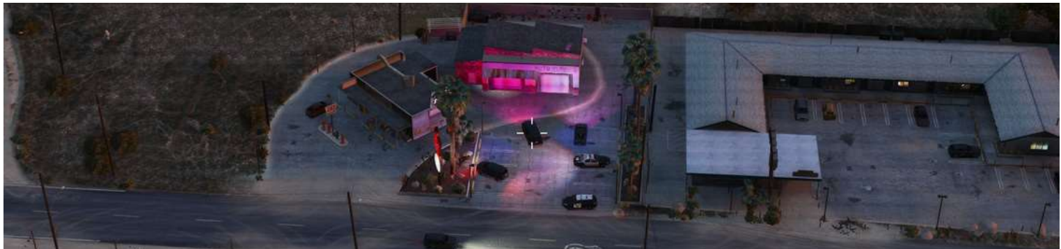
Perquisition d'un local de WalkersMotors sur la route 68